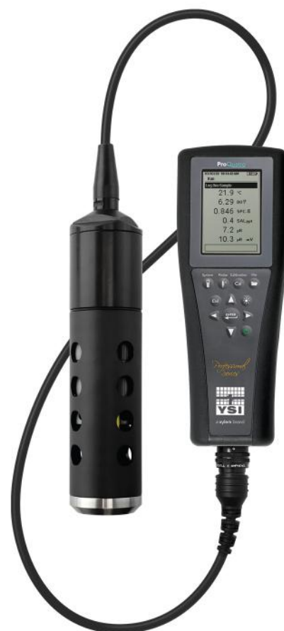
ProQuatro手持仪和 4 端口电缆组件最多可同时与四个传感器配合使用。